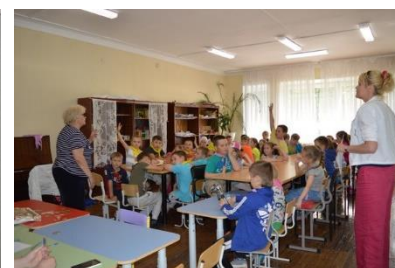
Творческий конкурс «ГОЛОС»