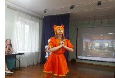
Весь мир - театр