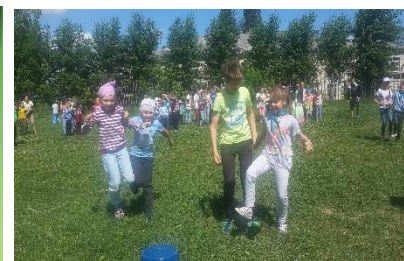
Игры на свежем воздухе