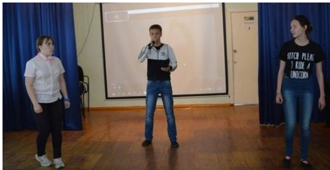
Выступление вожатых городского лагеря

Порадовали и вожатые отрядов – они исполнили композицию эстрадного певца Сергея Лазарева.