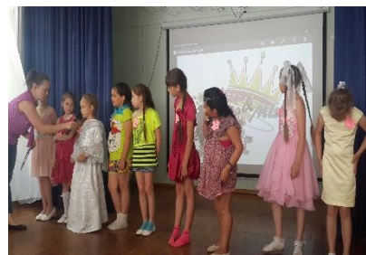
Мисс и Мистер Лагеря 2016