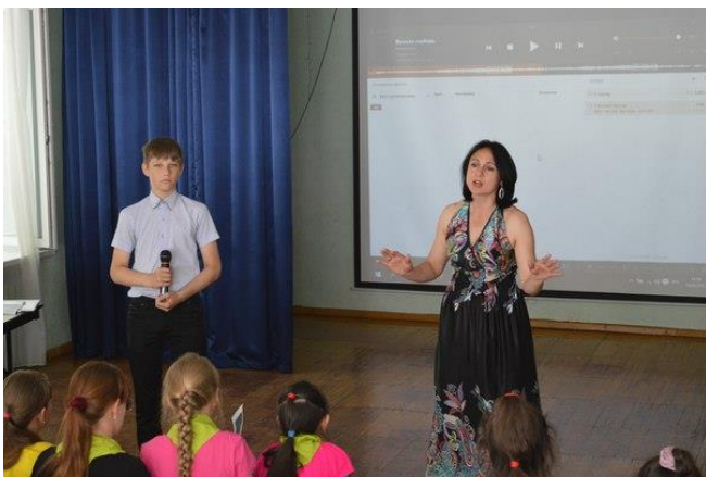
Выступление 1 отряда – «Кинозвезды»